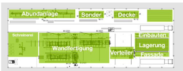
Blocklayoutplanung und Auswahl des Layouts mit dem optimalen Produktionsfluss.