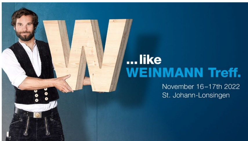
Figura 1: W come WEINMANN Treff, il punto di incontro per le costruzioni in legno.

Alla WEINMANN Treff vengono presentati nuovi impianti e vi è la possibilità di colloqui di consulenza individuali. Inoltre, si svolgono dimostrazioni dei macchinari dal vivo.